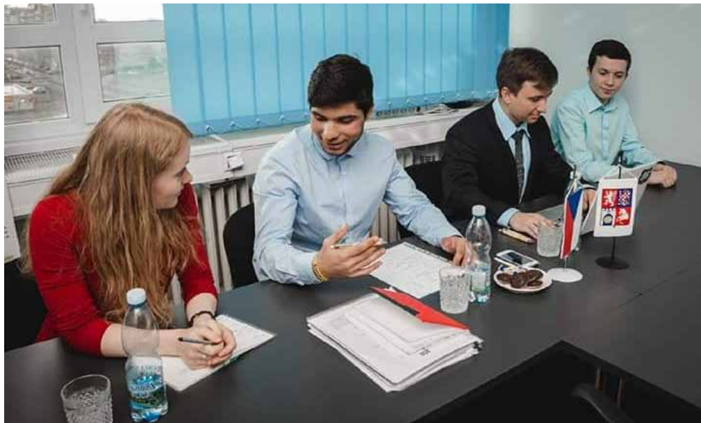
Část realizačního týmu organizace DĚTI V AKCI. Přípravy na její vznik trvaly více než rok.