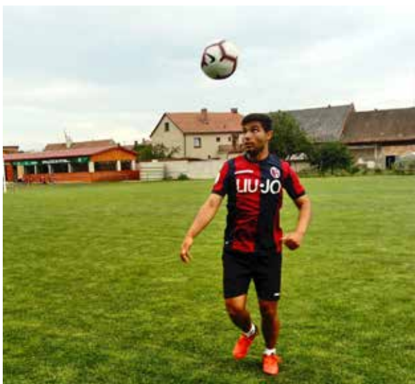
Skutečné dětství začalo až v DD. Začal hrát fotbal...

Už když jsme začali chodit na základku do Svitav, tak jsme tam viděli ty rozdíly. Děcka po škole si mohli jít zakopat ven, ale my jsme nemohli. Měli jsme fakt režim a museli jsme jít hned domů. A říkal jsem si: Panebože proč?