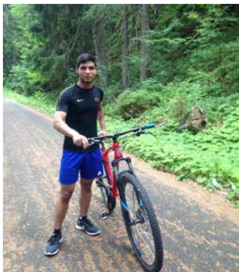
...a sport ho drží dodnes

Byli jsme na dovolené v Krkonoších, která probíhala v pohodě. Brácha si všiml, že při-