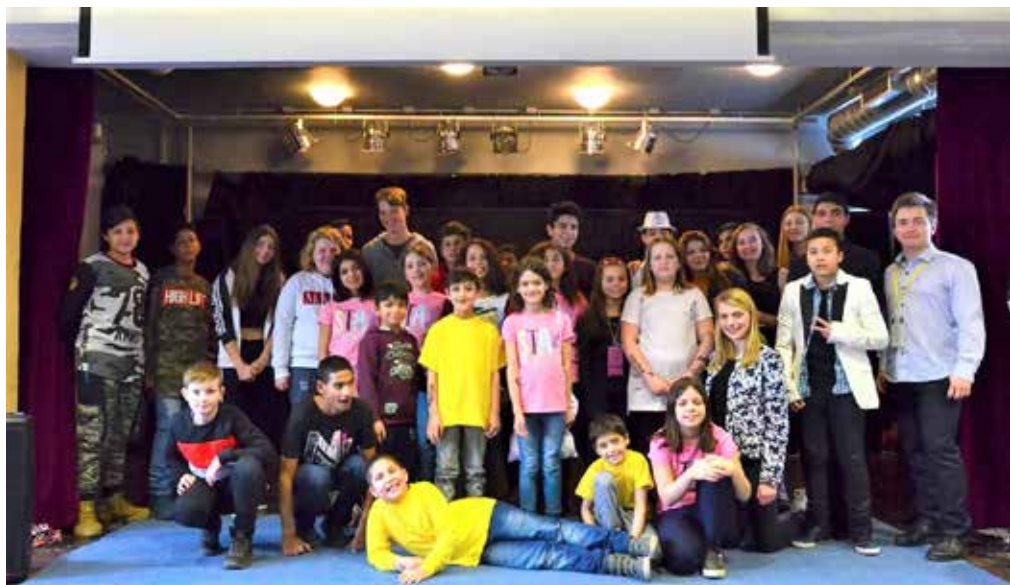
DĚTI V AKCI pořádají pro DD besedy, přednášky, talentové soutěže, dětské dny i sportovní turnaje...

Po 18 letech jsem musel absolvovat půlroční soudní proces s vlastními rodiči, které jsem 18 let neviděl. A najednou to začalo. Dostal jsem v 18 předvolání. Bylo toho hodně. Bylo to výživný, ošetřovný, které nebylo doplacený a ze strany rodičů tam byl dluh. Byl jsem tam jako účastník a jako protistrana.